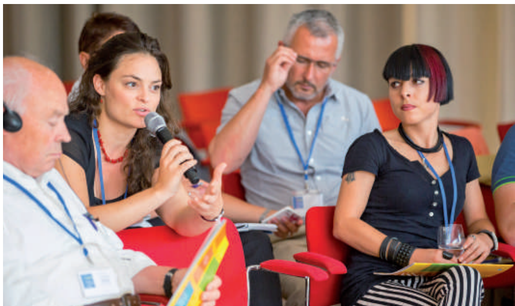
Élénk beszélgetés a „Minőség az önkéntes munkában“ műhelyben.