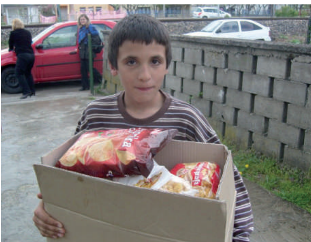
Szegény családok ellátása élelmiszer adományokkal.