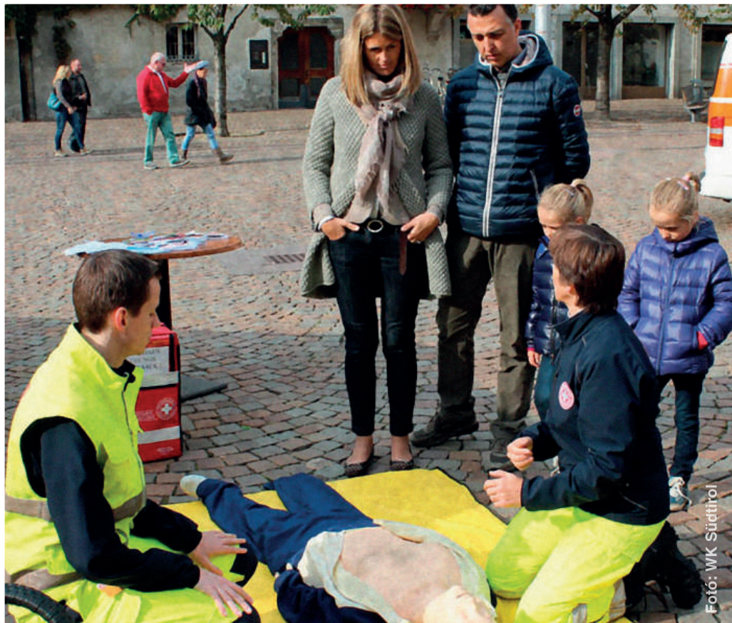
„Pár kézmozdulattal életet menteni” – Elsősegély akció, Dél-Tiroli WK.

A kampány célja a figyelemfelkeltés az elsősegély képzés fontosságára, az újraélesztési tevékenység hangsúlyozottabb szerepeltetése az iskolai oktatásban. ■