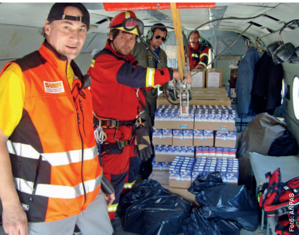
Az ASSR önkéntesei élelmiszert szállítanak a 2013. évi szlovákiai árvíz károsultjai számára.

A projekt eredményei a 2015. év végén egy zárókonferencia keretében kerülnek bemutatásra.