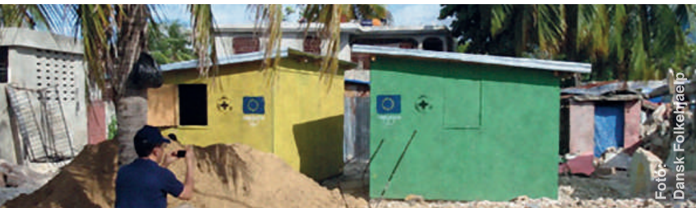
Dansk Folkehjælp: A szükségszállások felállításában szerzett 20 éves tapasztalat segít a fülöp-szigeteki katasztrófa áldozatainak is.