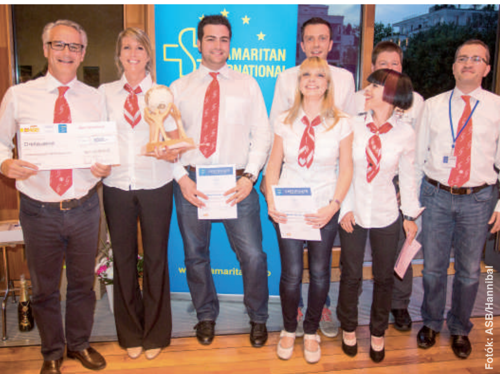
A mosolygó győztesek: A Dél-Tiroli WK csapata örül az önkéntes kampányt értékelő local AWARD elnyeréséért.

Minden projekt linkje megtalálható a SAM.I. honlapon. ■