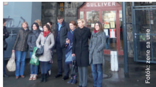
A delegáció résztvevői a kölni fedél nélküliek számára fenntartott központ, a „GULLIVER” előtt.

A boszniai lakáshiány égető problémájának megoldására a bosnyák szövetség a jövőben a fedél nélküliek segítézőse területén is működni kíván, ennek megfelelően és egy hosszú távú projekt keretein belül az ASB-vel közösen, Bihacban egy fedél nélküliek számára rendszeresített központot rendez be. Ebben a jórészt férfi fedél nélküliek kaphatnak szállást, ellátást és egészségügyi szolgáltatásokat. A projekt magába foglalja a segítők képzését, akik a szállást felkeresőket egyszerű feladatok elvégzése közben irányítják. ■