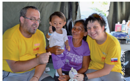
Végre újra tudnak nevetni – az ASSR gondoskodásának köszönhetően.