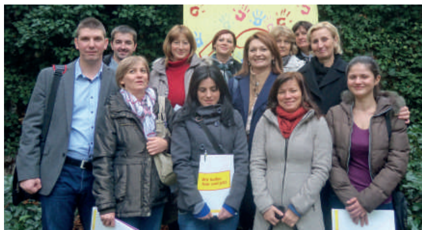
Bosnyák és horvát csoport az ASB Szövetségi Szervezete kölni kertjében.