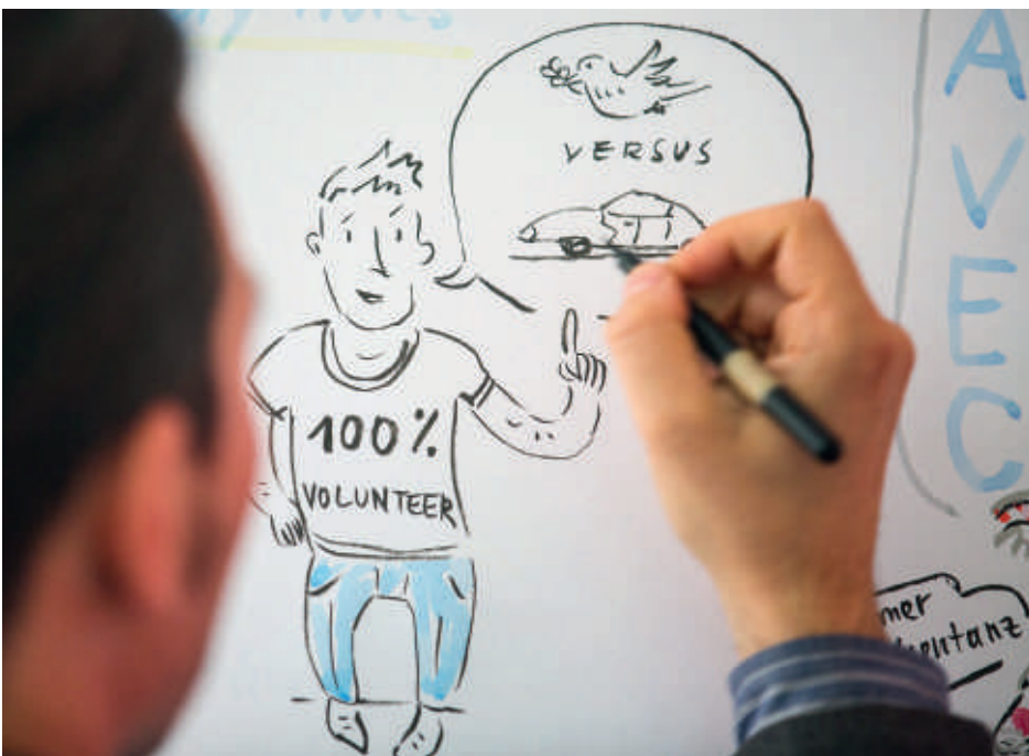
A teljes konferenciát rajzokkal örökítette meg Mike Klar. Az illusztrátor a Bauhaus-Universität Weimar-on és az Ecole d'Art et de Design Geneve-en illusztráció súlypontú vizuális kommunikációt tanult, jelenleg illusztrátorként, élő rajzolóként és grafikusként tevékenykedik. 2007 óta tagja az ILLUMAT művészeti csoportnak. Mike Klar fórummal kapcsolatos illusztrációi a SAM.I. honlapon, a http://bit.ly/MikeKlar alatt láthatók.

A rendezvénysorozattal kapcsolatos összes információ, beleértve az eredmény-jegyzőkönyveket is, a bit.ly/ForumAVEC oldalon található. ■